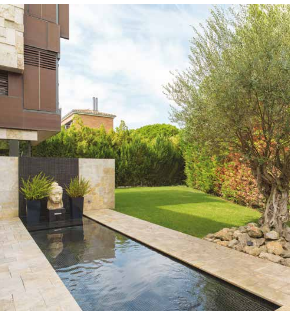
Sopra: acqua, legno e pietra nuovamente riuniti - anche all'esterno - per giocare un ruolo chiave ed evidenziare l'anima decorativa della casa. A destra: un grande divano domina la scena. Il living a doppia altezza, sembra appartenere al giardino attraverso le ampie vetrate che annullano i confini tra interno ed esterno.