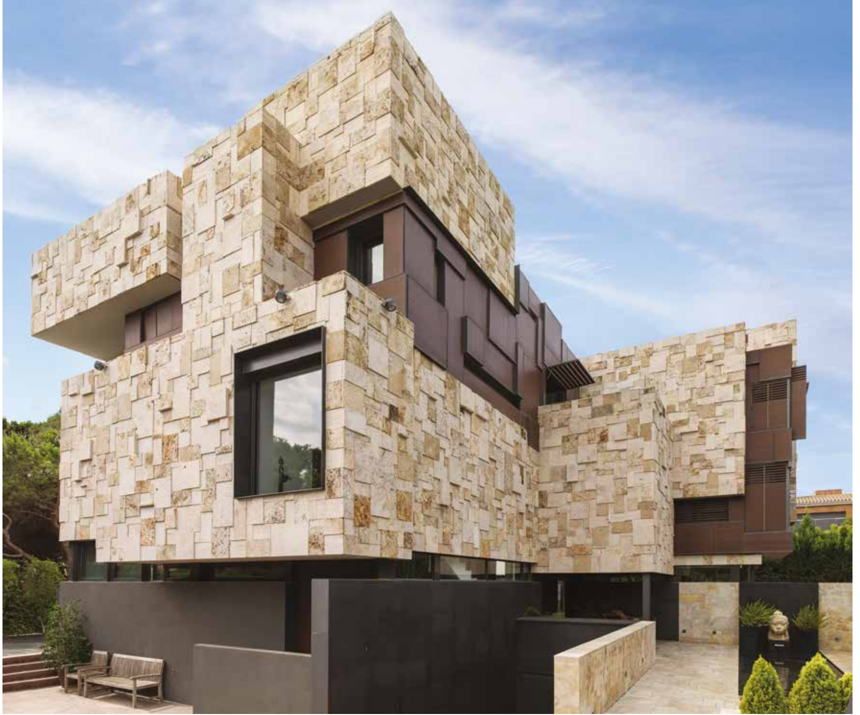
Questo prospetto è decisamente suggestivo, costruito con la pietra pomice estratta da una cava nei pressi di Girona. La forma irregolare ed il casuale gioco di sporgenze produce – in assenza di luce naturale – entusiasmanti effetti di luci e ombre potenziati da un abile studio illuminotecnico.