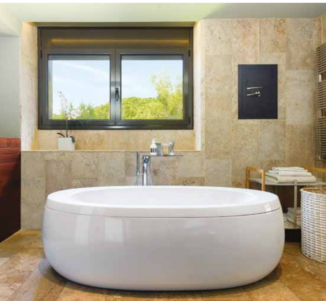
Gli spazi privati della casa sono generosi e sobri; il bagno, realizzato in pietra levigata, comunica con l'eleganza del legno che contraddistingue la camera. La suite si affaccia sulla piscina ed è caratterizzata da vetrate panoramiche.