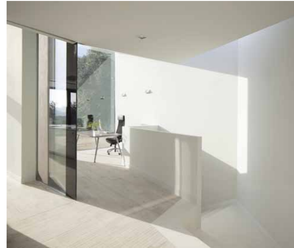
Casa y estudio YC / YC House and Studio

Localización Location: Castellcir, Barcelona, Spain. Arquitecto Architect: Santiago Parramón, RTA-Office. Arquitecto Técnico Technical Architect: Juan Carlos Hernández. Colaboradores Collaborators: BIS Arquitectes (Structural Engineering). Año proyecto Project date: 2011. Ejecución Completion: 2014. Superficie construida Built area: 290m 2 .